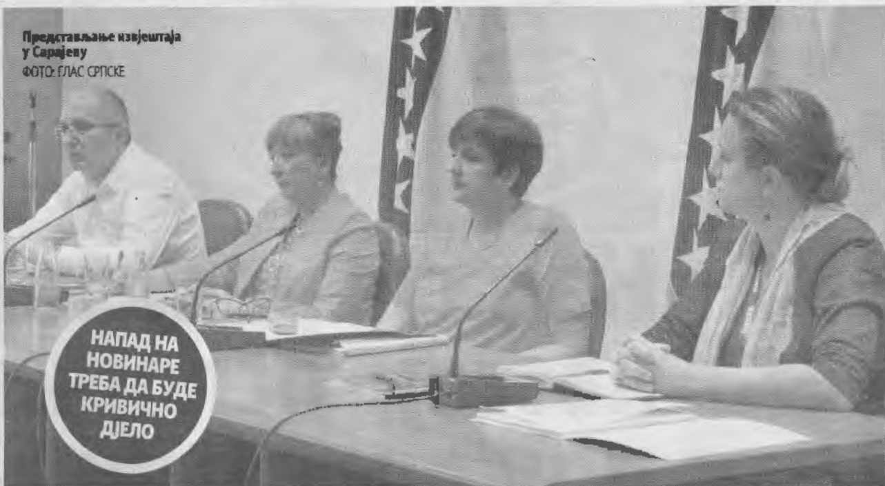
Представљање извјештаја у Сарајеву

Нажалост, присутно је насиље, узнемиравање и застрашивање новинара, рекла Џумхур