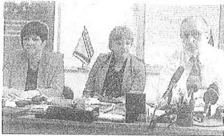
Ombudsmeni upozoravaju na kršenje prava građana

Institucija ombudsmana za ljudska prava BiH trebala bi odgovoriti na više od 400 pitanja iz svoje